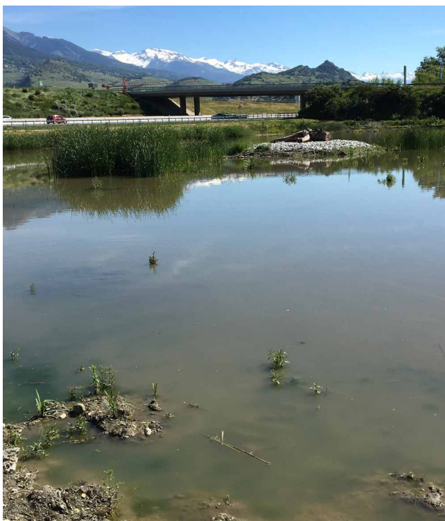
Mesure d'équilibrage environnemental : Création d'un biotope en rétablissant un milieu annexe au canal du Levant, et augmentation de la qualité de l'habitat piscicole