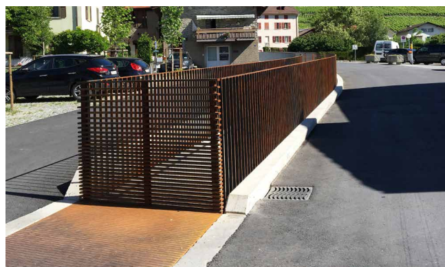
Aménagement en milieu urbain : Etablissement d'un concept esthétique dans le vieux-village