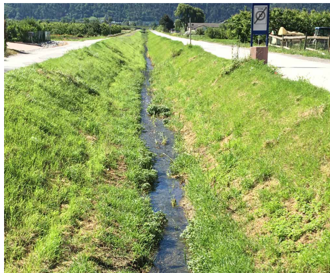
Maintenance de la situation actuelle en zone agricole