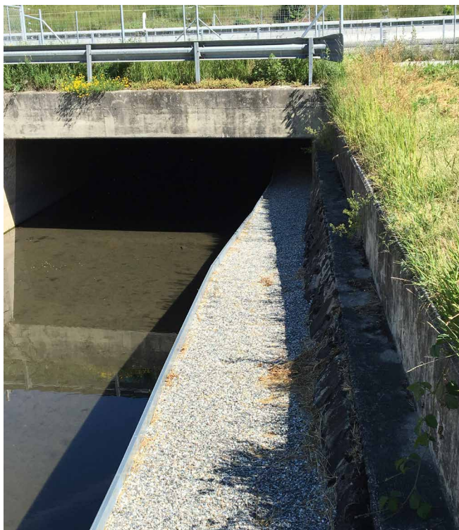
Mesure d'équilibrage environnemental : Création d'un passage à faune en dessous l'autoroute et des CFF