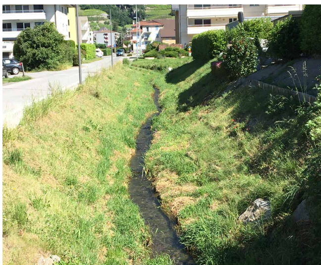
Aménagement en milieu urbain : Etablissement d'un concept de loisir et détente dans la plaine