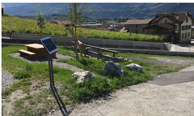
Dépotoir pour rétention des matériaux de charriages et laves torrentielles

Montant total de l'étape 1 : Fr. 4.5 millions.